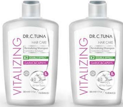
DR.C.TUNA VITALIZING SARIMSAKLI ŞAMPUAN 500 ml x 2 Adet - PK95840