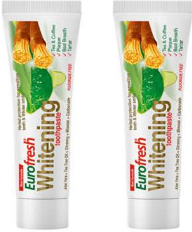
EUROFRESH ALOE VERALİ MİSVALKI BEYAZLATICI DİŞ MACUNU 112 g x 2 Adet - PK95839