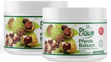
DR.C.TUNA AT KESTANESİ MASAJ JELİ 500 ml x 2 Adet - PK95841