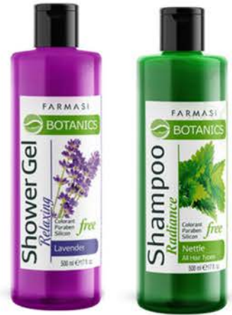
BOTANICS LAVANTA RAHATLATICI DUŞ JELİ 500 ml