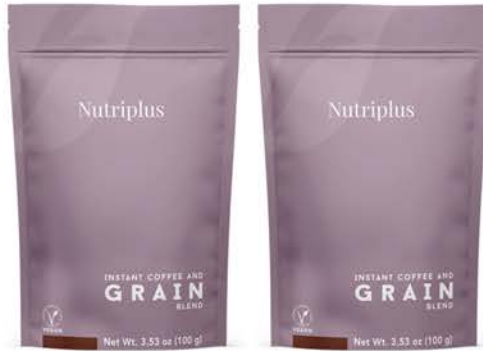
NUTRIPLUS TAHİLLİ KAHVE 100 g x 2 Adet - PK95843