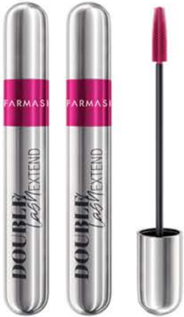
DOUBLE LASH EXTEND ÇİFT ETKİLİ MASKARA 12 ml x 2 Adet - PK95842